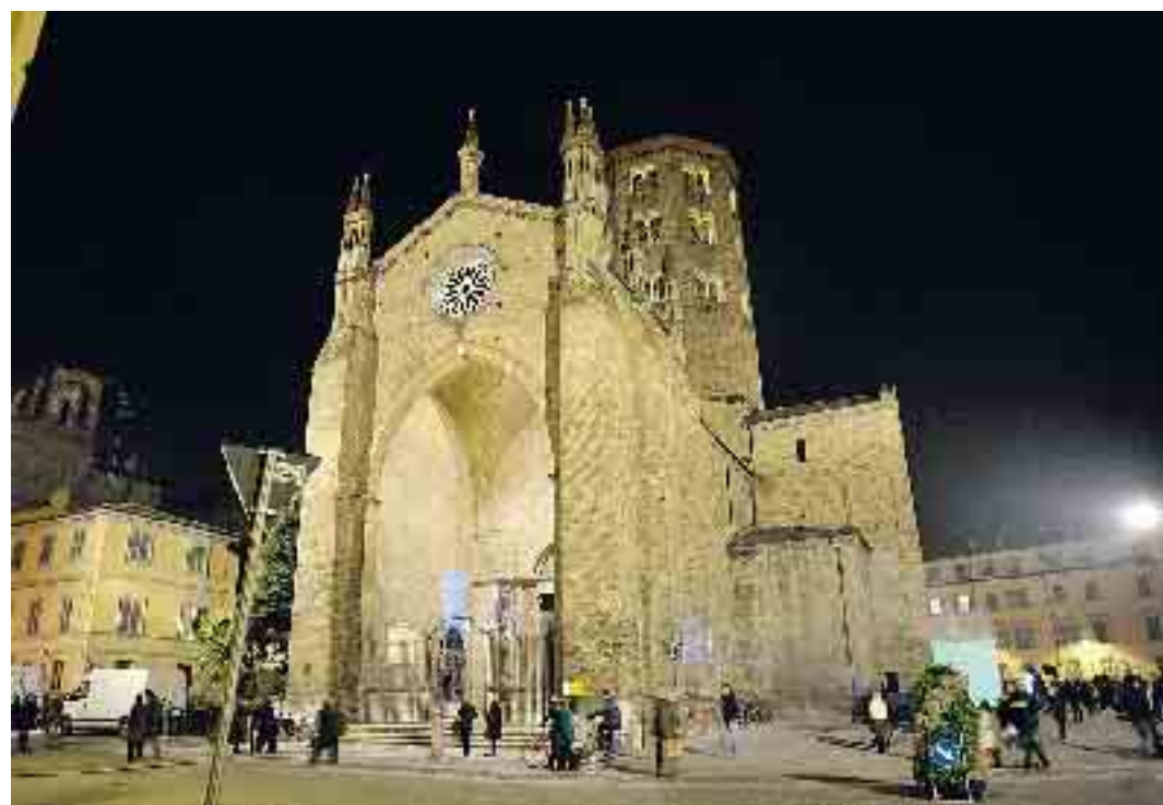
La basilica vista dal lato della Porta del Paradiso, un grande "sguardo" storico sulla perla della via Francigena