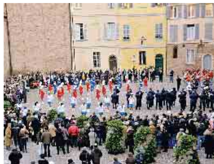
L'esibizione corale delle quattro bande piacentine