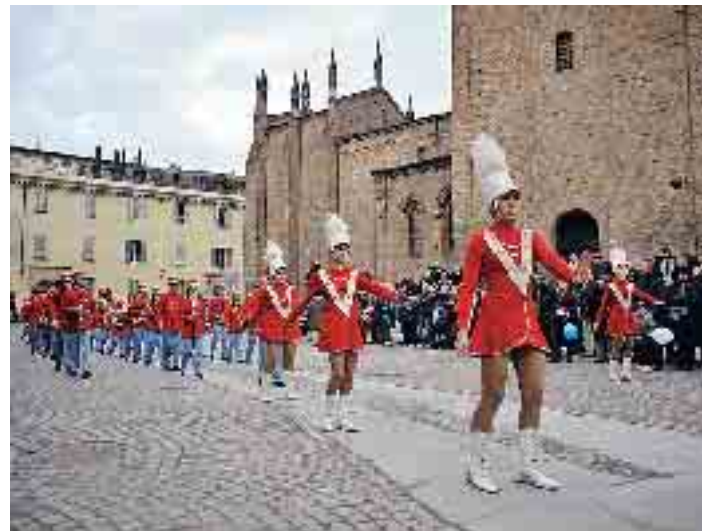
Le majorettes rosso-vestite della banda di Pontedellolio