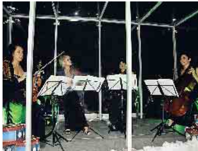
"Le Cameriste Ambrosiane" si esibiscono in un cubo di plexiglass