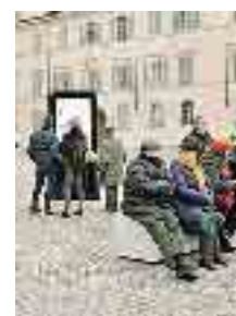
Panchine e maxischermo

la verità c'era chi puntava a riportare in luce l'acciottolato sotto l'asfalto. Alla fine però l'idea dei cubetti di porfido rosso, condivisa con la Soprintendenza, si è rivelata vincente, come racconta il sindaco Reggi dando, ancora una vol-