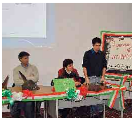
Sopra: l'incontro all'Istituto Casali; sotto: l'Acat con gli studenti dell'Isii Marconi